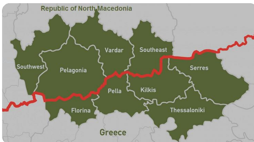
Εικόνα 1. Χάρτης Επιλέξιμων Περιοχών Προγράμματος

Ο συνολικός προϋπολογισμός του Προγράμματος είναι 45.470.066 ευρώ, εκ των οποίων 85% (38.649.552 ευρώ) προέρχονται από κοινοτικούς πόρους, μέσω του μηχανισμού προενταξιακής βοήθειας, και 15% (6.820.514 ευρώ) από εθνικούς πόρους των δύο χωρών που συμμετέχουν στο Πρόγραμμα.